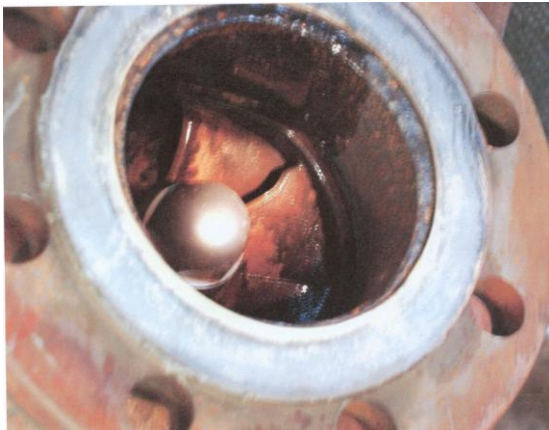
Pumpe vorher sauber gereinigt