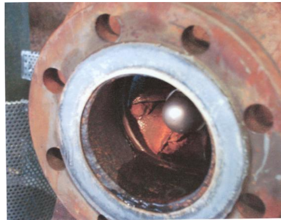
Pumpe nach 6 Wochen Test